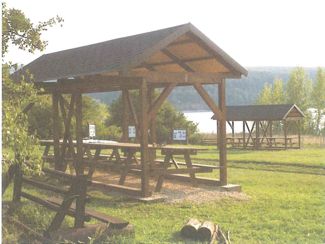
6. Место отдыха.