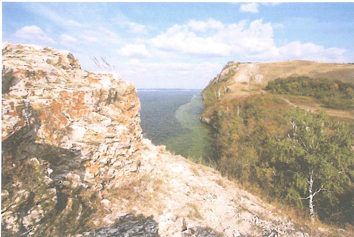
1. Молодецкий курган, вид с Усинского кургана.