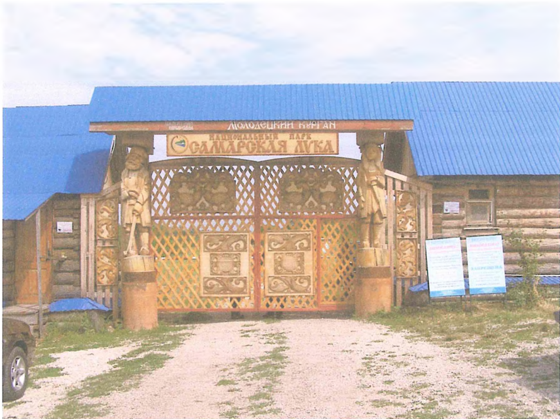
5. Входная группа тропы.