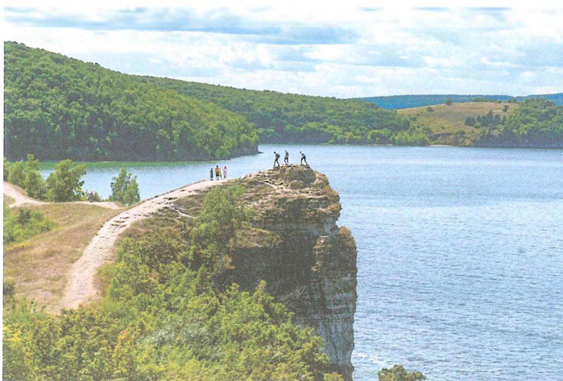
2. Гора Девья.