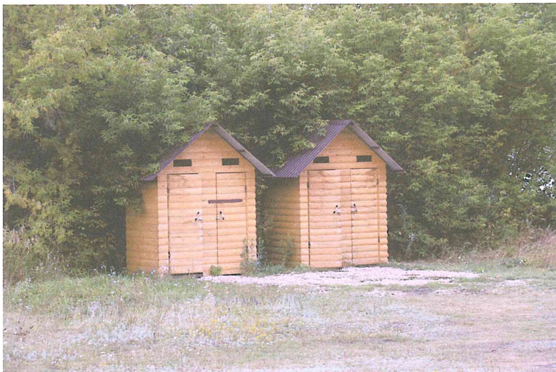
4. Туалеты у КПП.