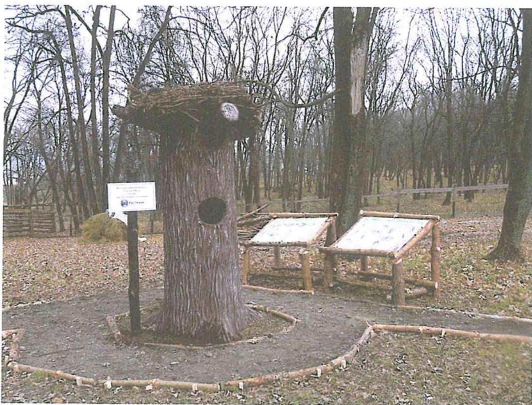
2. Модельный экспонат «Гнездо орла».