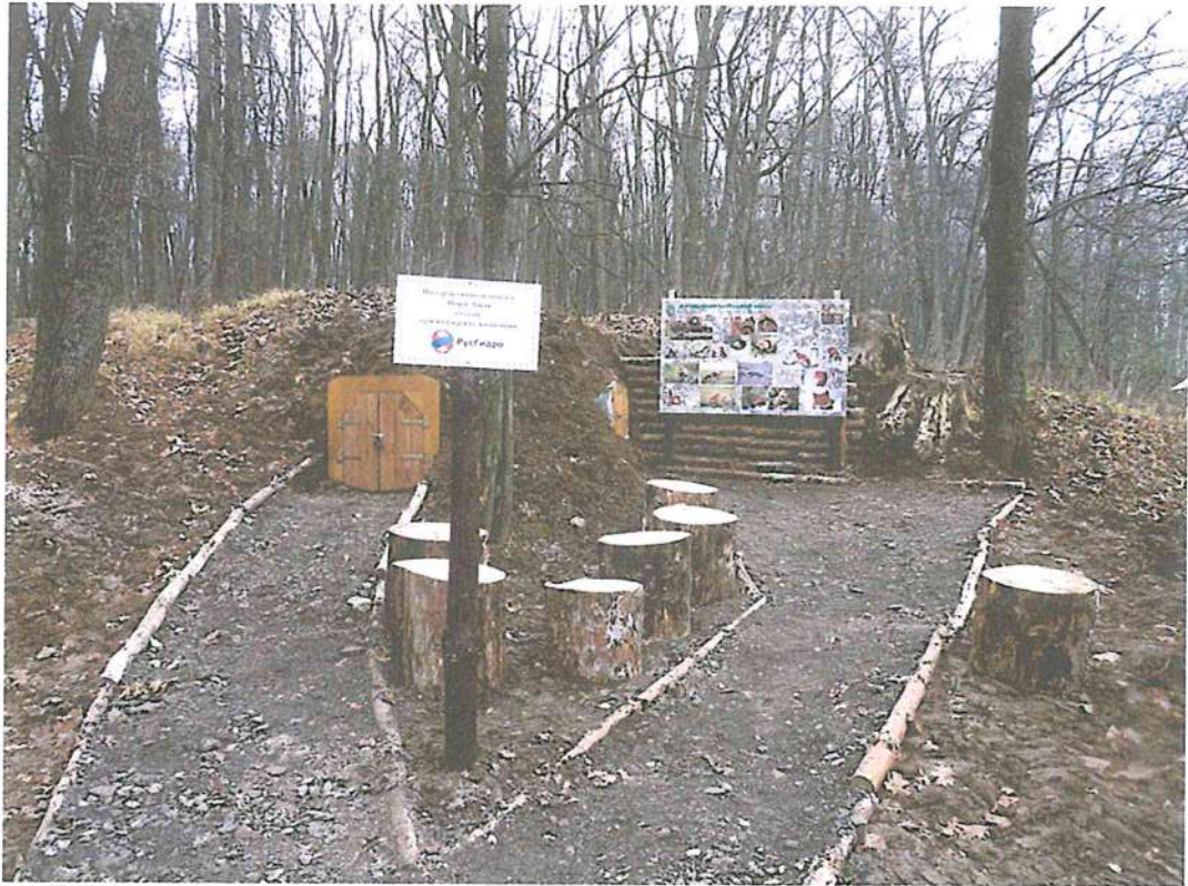
3. Модельный экспонат «Нора лисы».