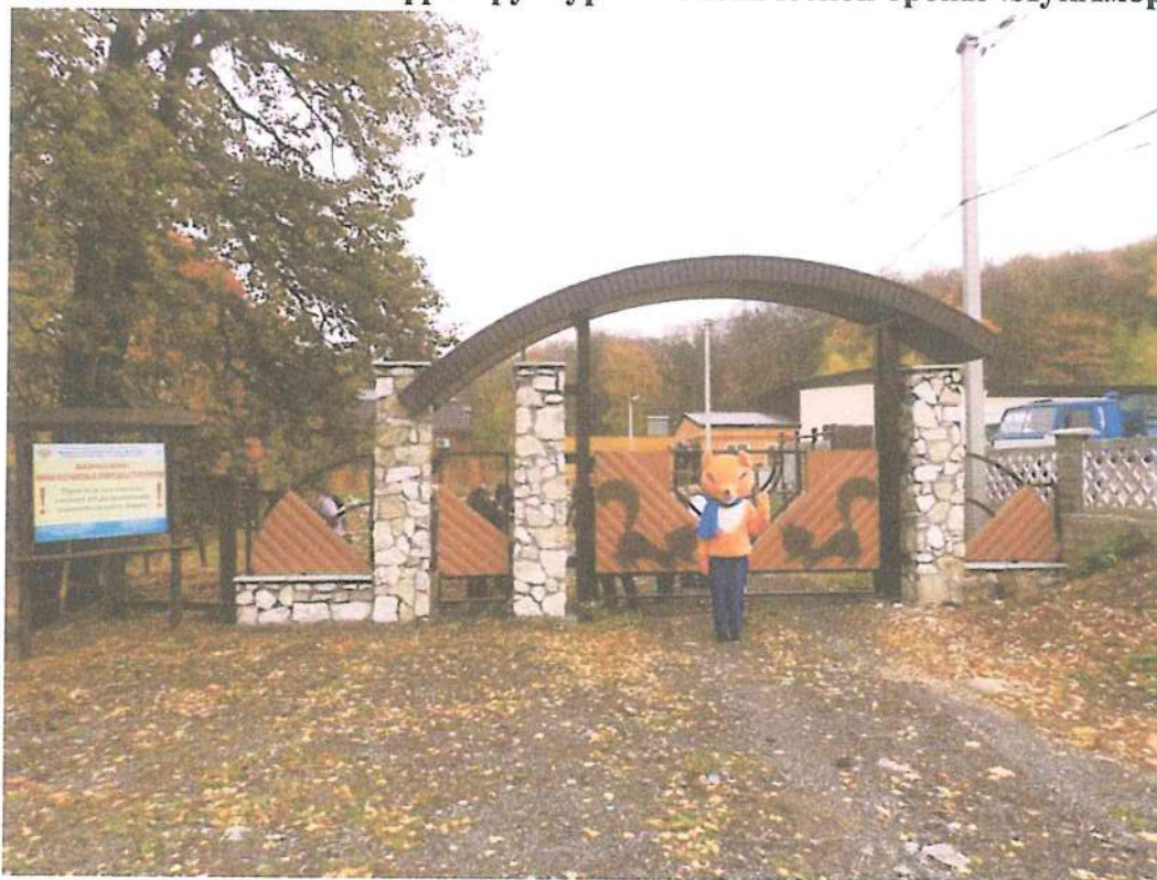
1. Ворота входной группы.