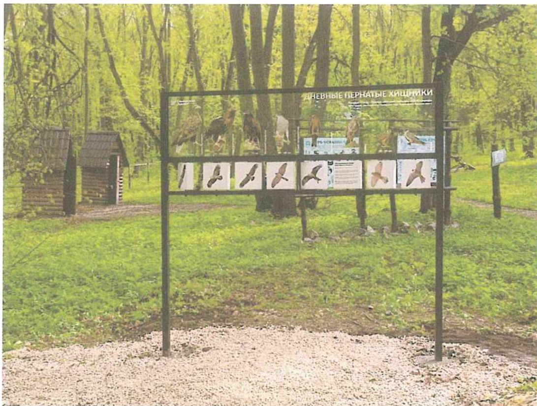
5. Интерактивный стенд «Птицы».