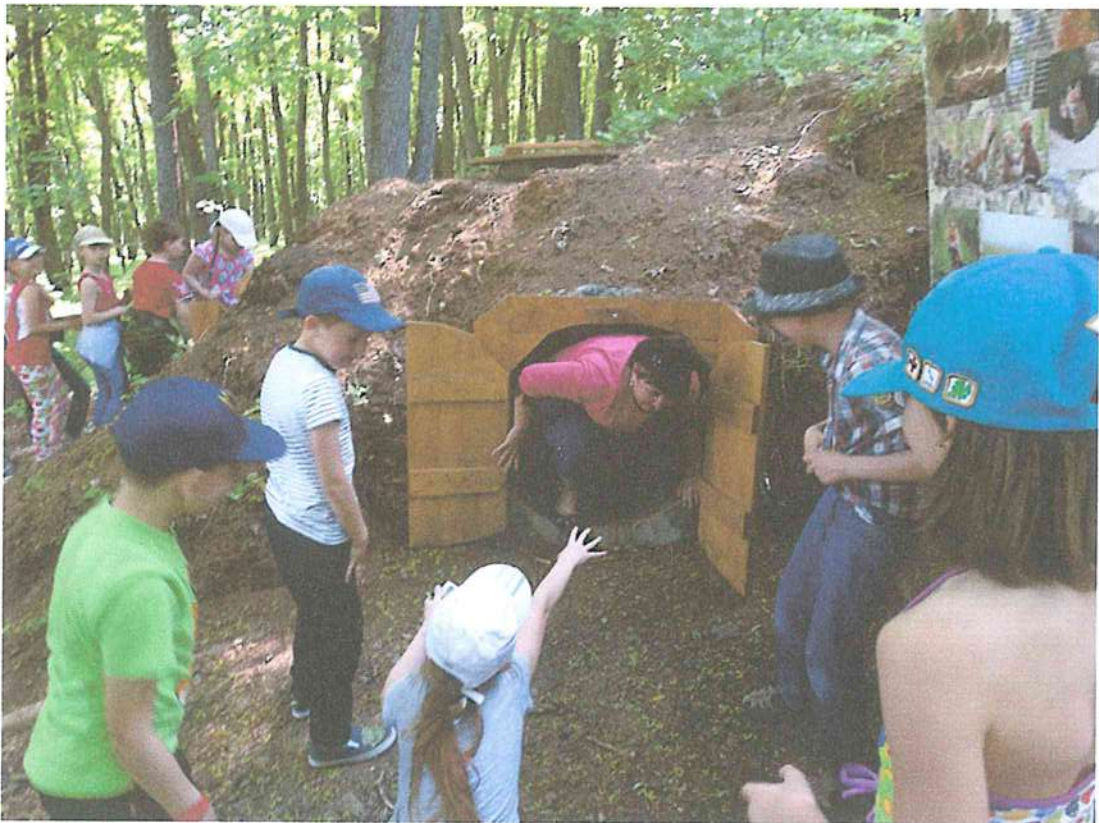
4. Модельный экспонат «Нора лисы».