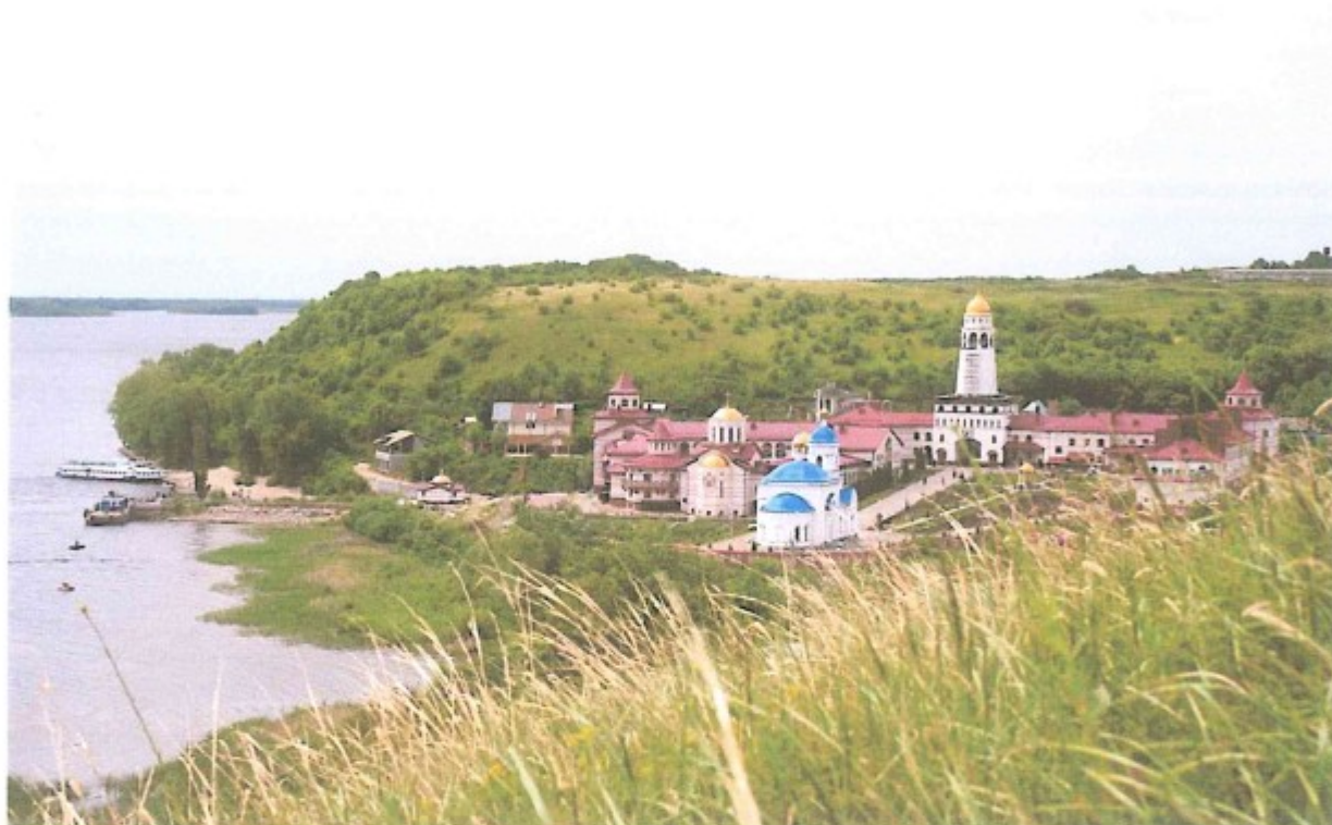
1. Монастырь в селе Винновка.