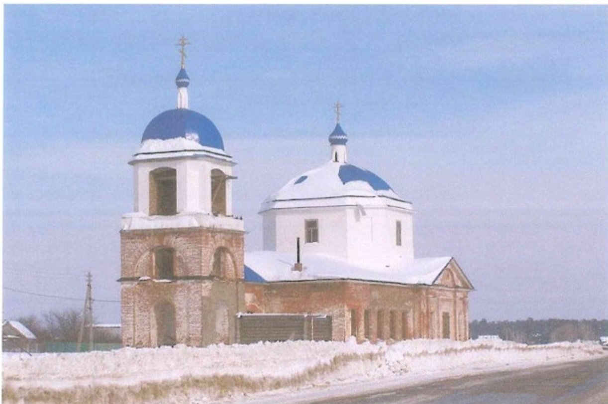
5. Храм Успения Святой Богородицы.