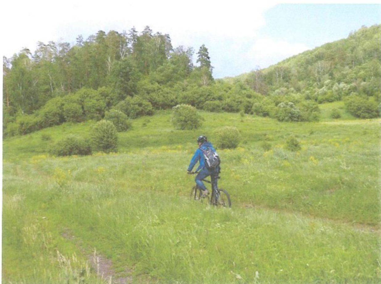
4. В оврагах Самарской Луки.