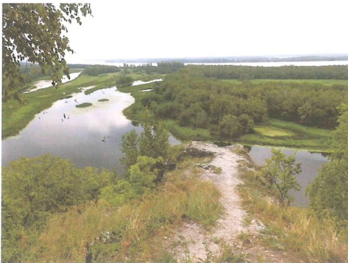
6. Вид с Вислого камня на Змеиный затон. Автор фото М. Андрианова