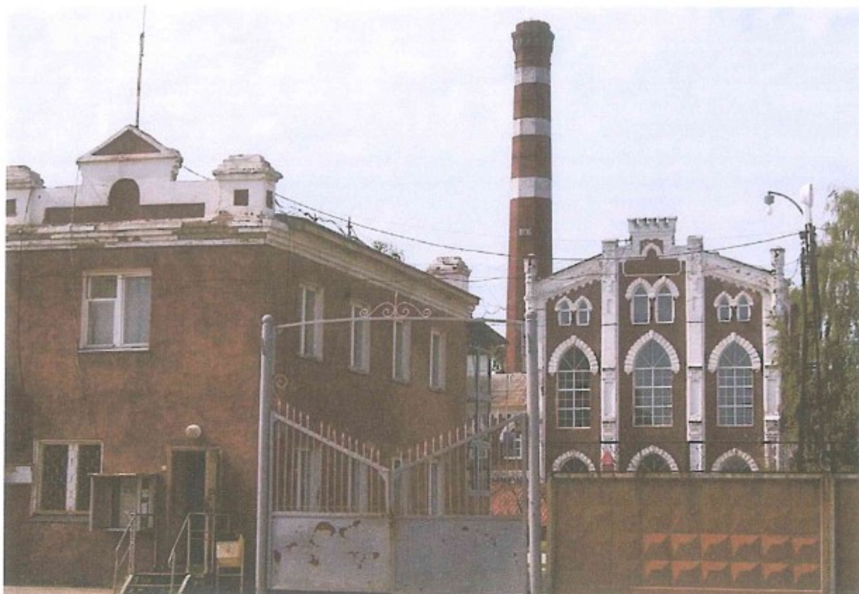
3. Здание спиртового завода.