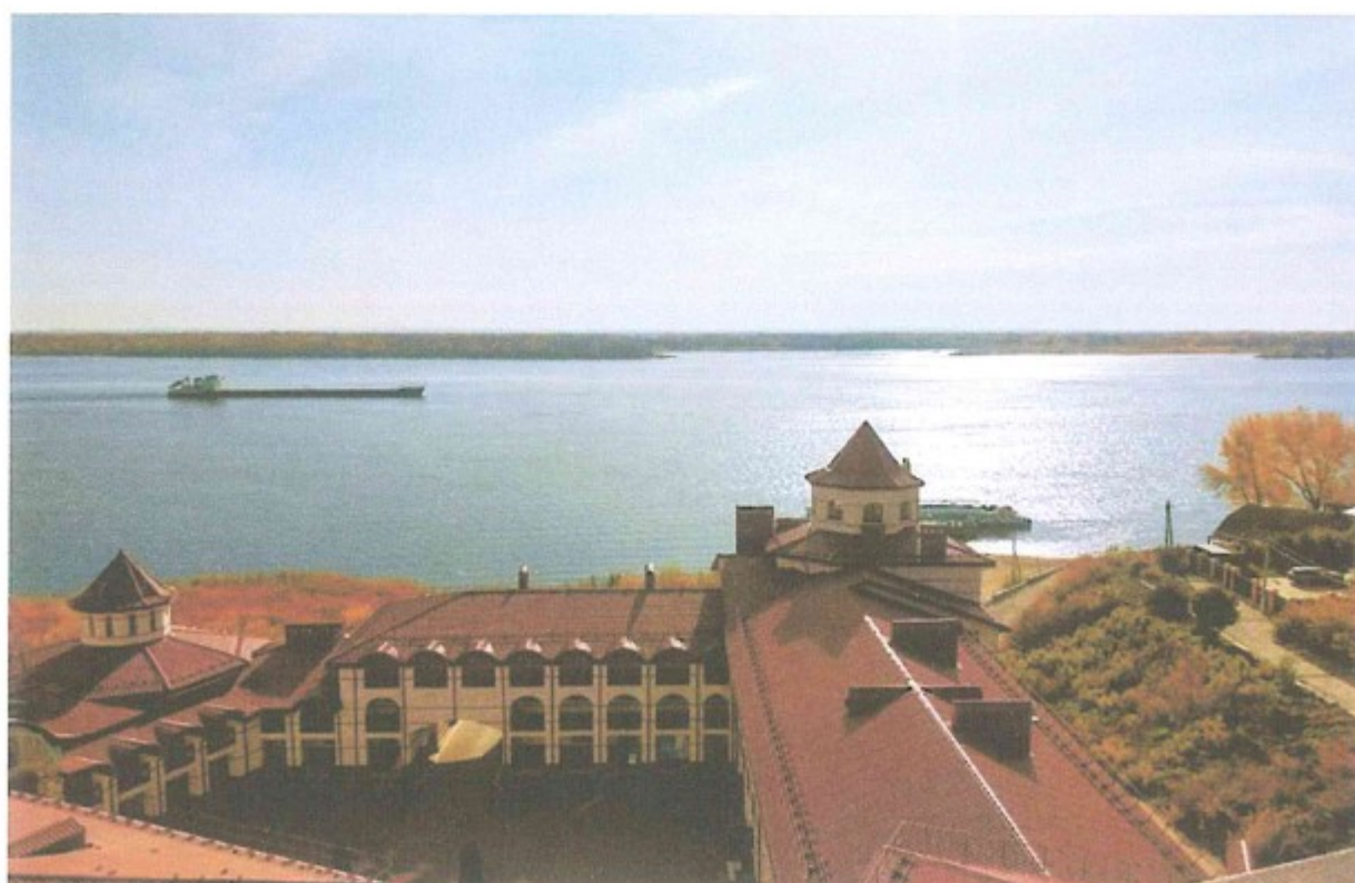
2. Вид с колокольни Казанского монастыря.