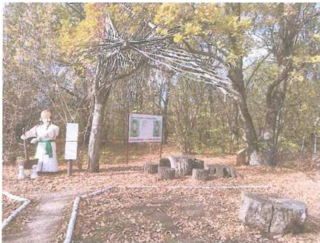
4. Знакомство с культурой мордвы.