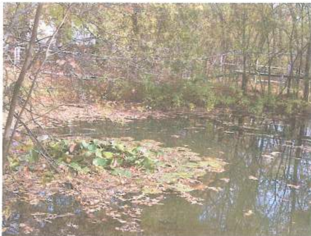
6. Озеро с кувшинками. Автор фото А. Калегина