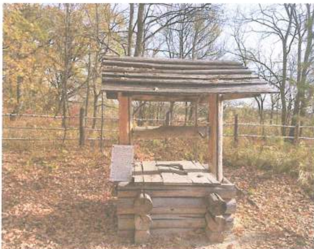
7. Колодец.