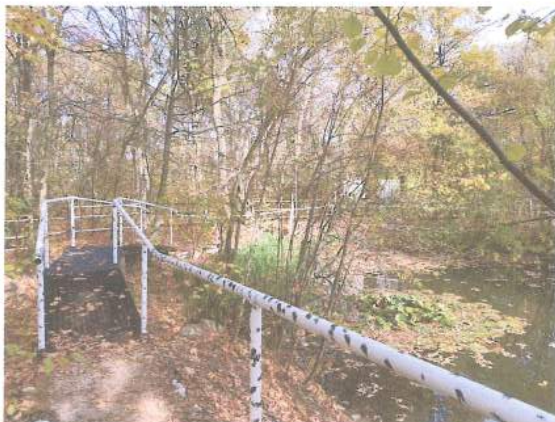
5. Металлический настил вокруг озера.