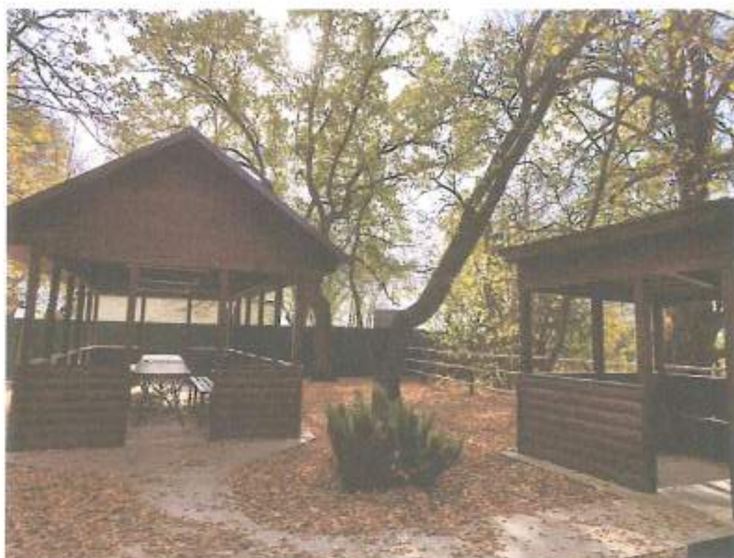
2. Маленькая и большая беседки.