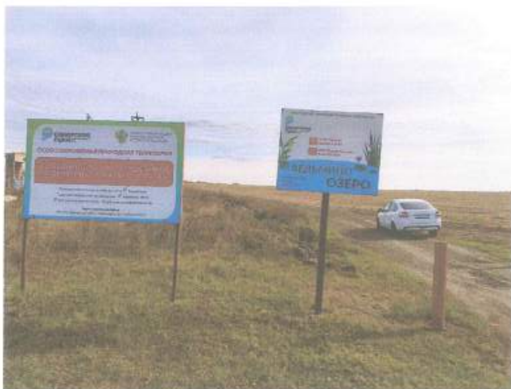
1. Поворот на грунтовую дорогу, начало/окончание экотропы.